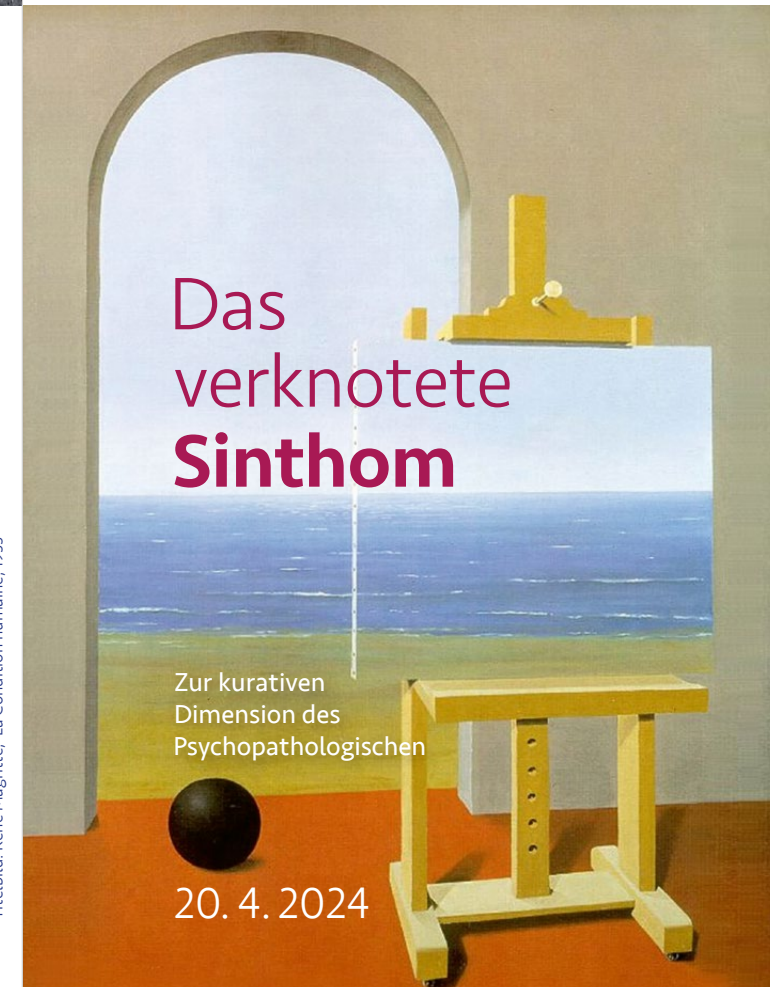
Titelbild: René Magritte, La Condition humaine, 1933